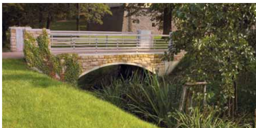
Most přes Ctěnický potok