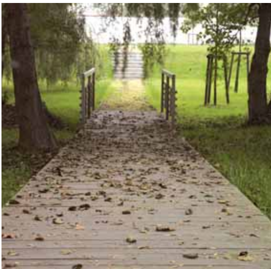
Láoka mokřadem s mostkem přes Ctěnický potok