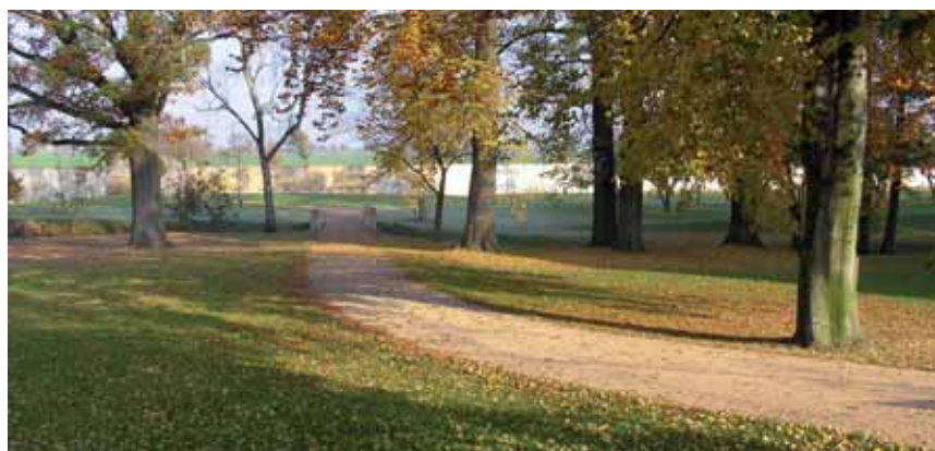
Cesta od zámku