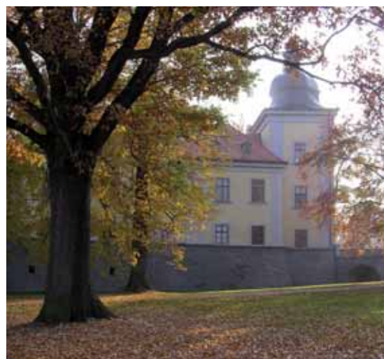
Ctěnický zámek z parku

Nový objekt obslužného zázemí – dům Zmije – je umístěn na pozemku podél severozápadní ohradní zdi, navržen je jako lehká dřevostavba opláštěná prkny naležato pokládanými na opeření. Nacházejí se v něm šatny a sklady nutné pro provoz zahradnictví. Je zalomen tak, aby vstupem byl orientován ve stejné vzdálenosti od osy průhledu jako vstup do stávajícího skleníku. Takto vytvořený nástupní prostor při vstupu z parku je z druhé strany ohraničen ovocnými stromy (třešněmi) ve stejném tvaru symetricky od osy průhledu. Před domem a stávajícím skleníkem je obslužná zpevněná plocha. V těžišti otáčení obslužné dopravy je vysazen strom (jerlín japonský). Vjezd do zahradnictví je prolomen do ohradní zdi jako pokračování obslužné komunikace vedoucí podél severní ohradní zdi parku. Pozemek se rozkládá na dvou úrovních, v nižší z nich je umístěn nový dům, vstup do stávajícího skleníku, rezerva pro záhony a zpevněná plocha navazující na nový obslužný vjezd do zahradnictví. Z této nižší úrovně je betonovými jezdeckými schody zajištěn přístup na vyšší úroveň, na níž jsou rozmístěny záhony a vinice při severovýchodní ohradní zdi. Podél severozápadní ohradní zdi je vysazena řada stromů (broskvoně) v těsném sponu (4,5 m) tvořících pozadí obou staveb, stávajícího skleníku a objektu obslužného zázemí.