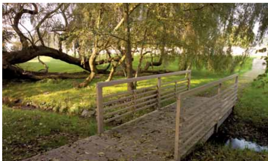
Dubový mostek přes Ctěnický potok