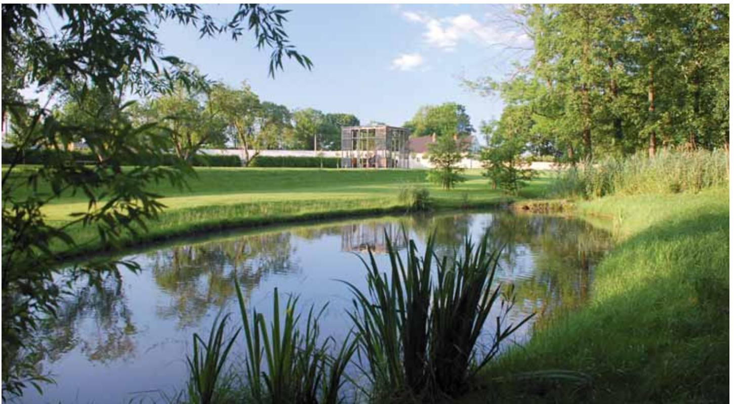
Rybíník na Ctěnickém potoce s altánem