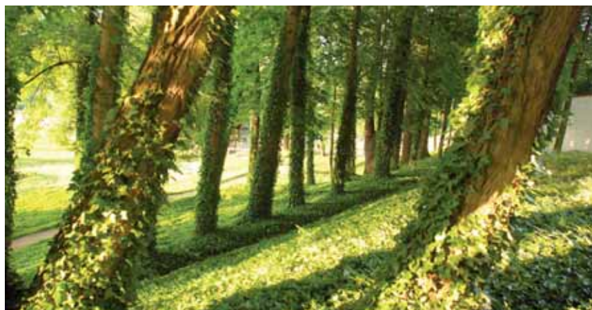
Listnatý lesík s podrostem břečtanu